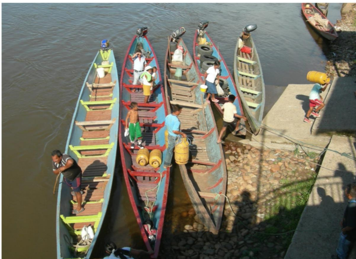
Frontera Ecuador – Colombia.