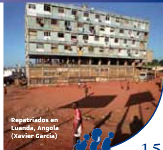
Repatriados en Luanda, Angola (Xavier García)