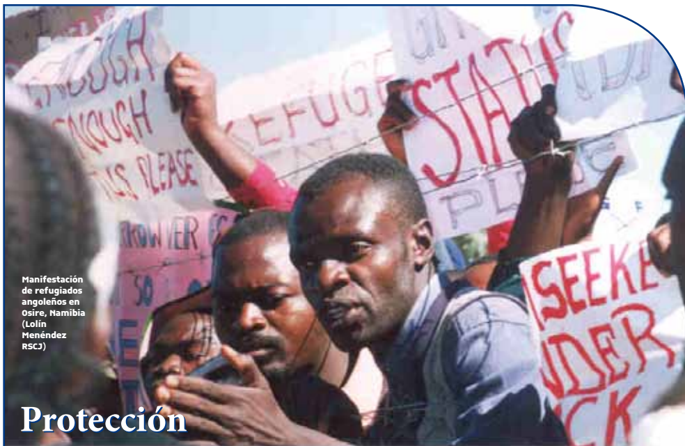
Manifestación de refugiados angoleños en Osire, Namibia