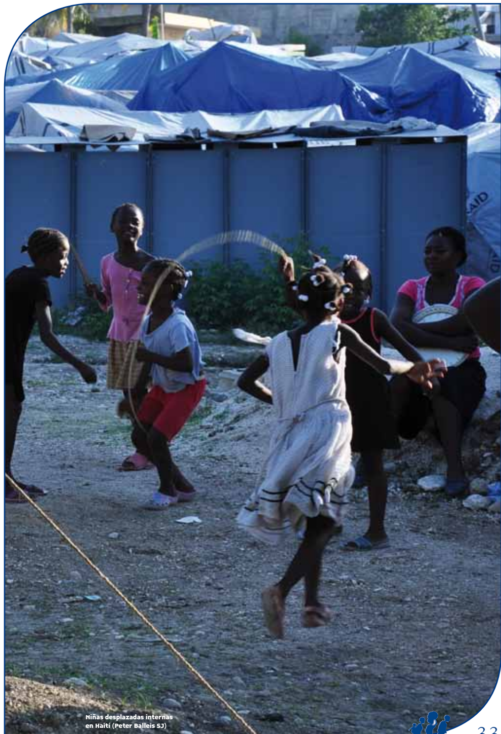
Niñas desplazadas internas en Haití (Peter Balleis S3)