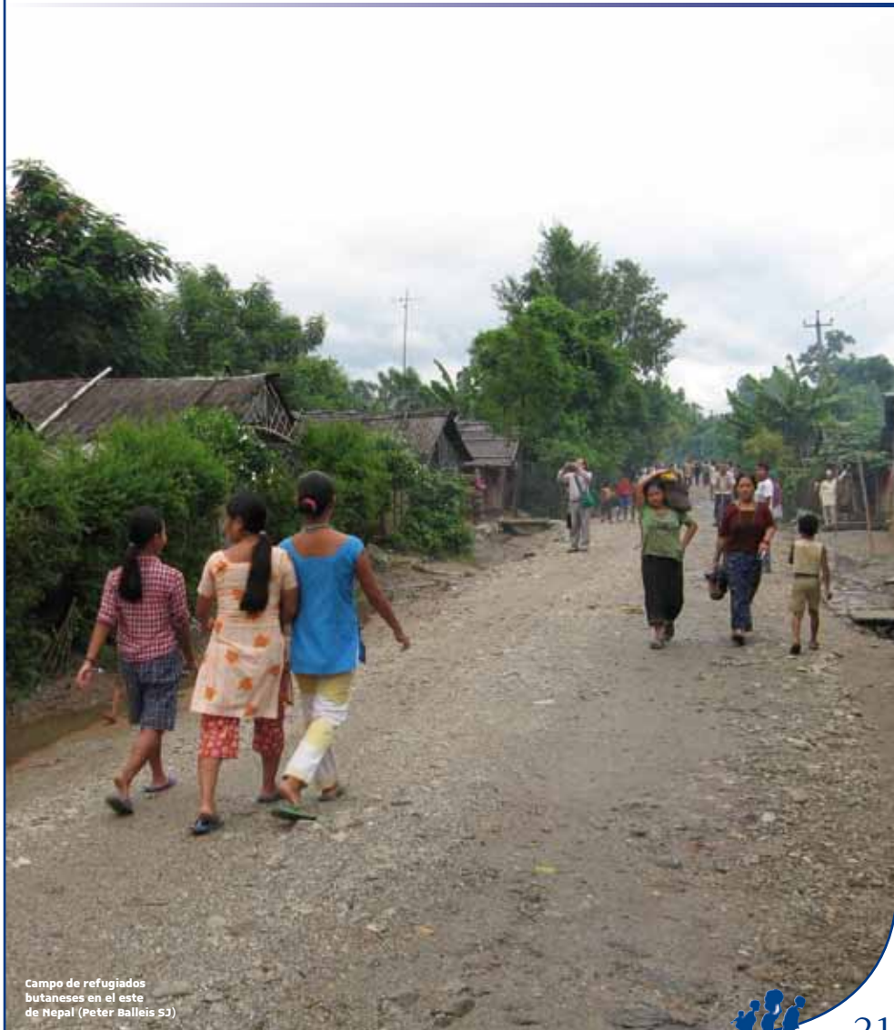
Campo de refugiados butaneses en el este de Nepal

A principios de los 90, SJR ayudó a la repatriación de refugiados camboyanos y a su reintegración en la sociedad tras su regreso de los campos de Tailandia. Se ofreció asistencia física - alojamiento y enseres materiales- y se fomentó la construcción de relaciones estrechas en los pueblos con el objetivo de que trabajaran juntos y reconstruyeran la confianza.