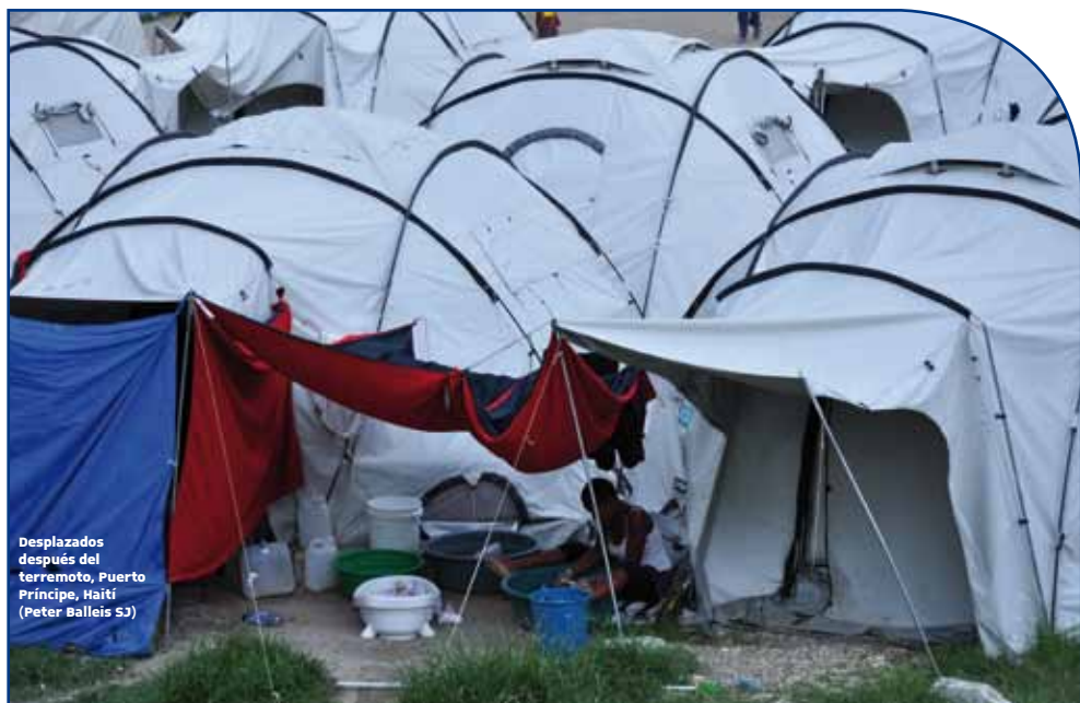
Desplazados después del terramoto, Puerto Príncipe, Haití

comunidades es cada vez más urgente, debido a las inundaciones de agua de mar, que causan la salinización del suelo, inseguridad alimentaria, vulnerabilidad a los desastres naturales y otros factores. El reasentamiento será voluntario y se hará en el curso de los próximos 10 años. El reasentamiento de las primeras 40 familias de las islas Carteret está previsto para mediados del 2011. Aunque estas tierras son propiedad del gobierno, se han negociado acuerdos con los propietarios consuetudinarios para asegurar el apoyo de la comunidad al programa. Este es uno de los primeros reasentamientos de población planificados debido a que la tierra se considera inservible por causa del aumento del nivel del mar y de la degradación medioambiental. Las autoridades de Bougainville están llevando a cabo una evaluación de las necesidades tanto de la población que va a ser reasentada como de la comunidad en el lugar propuesto para su reasentamiento. SJR Australia y ACNUR en Papúa Nueva Guinea aportan el soporte técnico para esta evaluación de las necesidades.