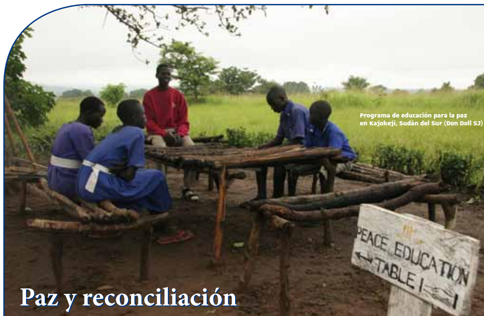
Programa de educación para la paz en Kajokeji, Sudán del Sur