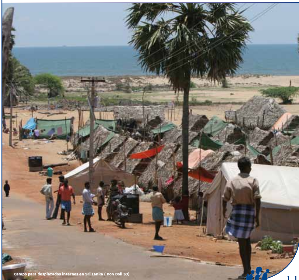
Campo para desplazados internos en Sri Lanka ( Don Doll SJ)

A nivel internacional, SJR persigue activamente una respuesta global más contundente a las emergencias que ocasionan desplazamientos internos, a través del seguimiento de los clusters (grupos sectoriales) de asistencia a los desplazados internos, y apoyando las actividades del ACNUR en este ámbito tan importante.