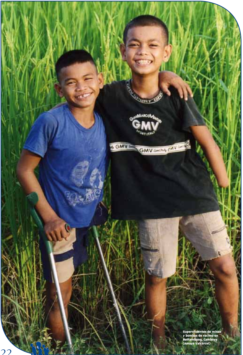
Supervivientes de minas y bombas de racimo en Battambang, Camboya (Amaya Valcárcel)