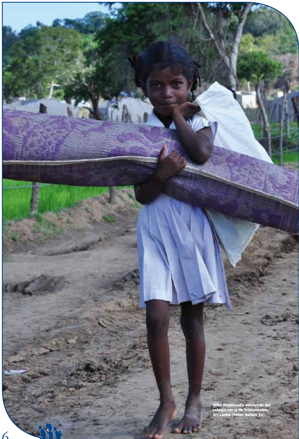
Niña desplazada volviendo del colegio cerca de Trincomalee, Sri Lanka (Peter Balleis 53)