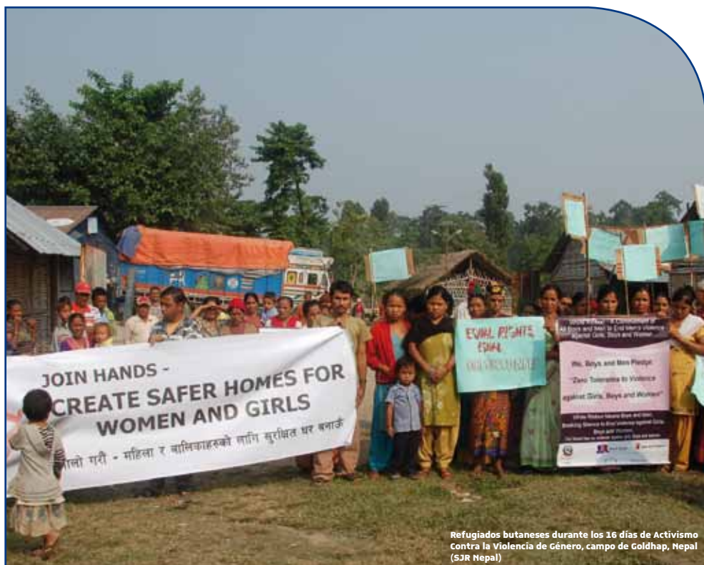
Refugiados butaneses durante los 16 días de Activismo Contra la Violencia de Género, campo de Goldhap, Nepal

En Malta, SJR ha contratado los servicios de un psicólogo y de una enfermera para ofrecer tratamiento y apoyo a las víctimas de violencia sexual. SJR Malta mantiene sesiones de grupo con detenidos que han sido víctimas de violencia sexual y de género y publica folletos de información para concienciar a la población.