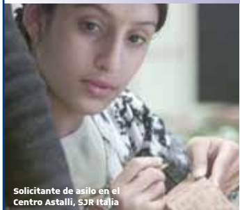
Solicitante de asilo en el Centro Astalli, SJR Italia

SJR Camboya trabaja con un número creciente de refugiados urbanos y solicitantes de asilo. La oficina ofrece pequeños préstamos para que los refugiados y los solicitantes de asilo puedan empezar un negocio. La mayoría de los receptores de préstamos ha podido establecer puestos callejeros de venta de comida, generalmente trabajando junto a miembros de sus comunidades. Esto les ha dado la oportunidad de generar ingresos, siendo el empleo remunerado por lo general difícil de encontrar.