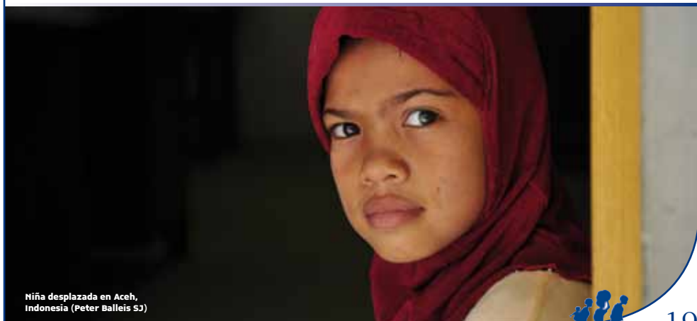
Niña desplazada en Aceh, Indonesia

El gobierno de Camboya ha implementado recientemente su propia legislación nacional en materia de estatuto de refugiados. En conformidad con las nuevas normas, SJR Camboya garantiza que a los solicitantes de asilo cuya petición ha sido rechazada se les explique el porqué de esta negativa, y que tengan la oportunidad de recurrir la sentencia.