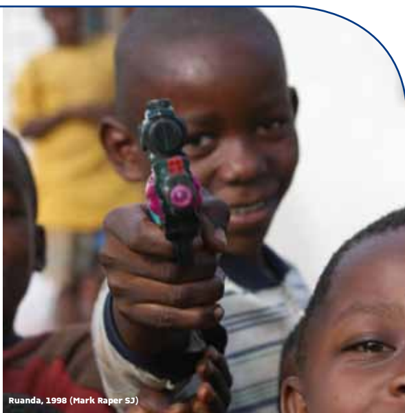
Ruanda, 1998 (Mark Raper SJ)