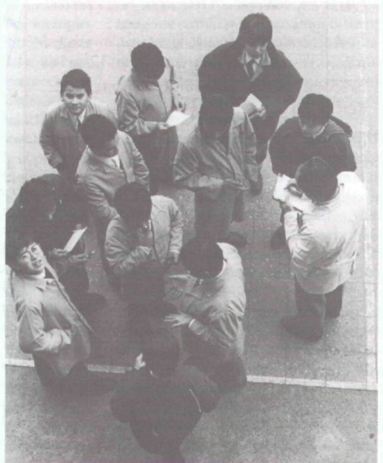
EXTREMADAMENTE SENSIBLE A LAS NECESIDADES DE CADA UNO, LA PEDAGOGÍA IGNACIANA CONSIDERA LA DIVERSIDAD DE LAS CUALIDADES COMO UN ENRIQUECIMIENTO Y DE NINGUNA MANERA COMO UNA INJUSTICIA

Si la cura personalis se puede realizar, según las diversas culturas, de muchas maneras, sin embargo presupone siempre la convicción de que el otro tiene necesidad de una ayuda gratuita y estimulante para poder pasar del estadio de niño al de persona libre y solidaria. Los jesuitas creían profundamente en esta cura personalis hasta el punto de abandonar a veces la predicación a las muchedumbres para dar preferencia a la conversación espiritual de persona a persona. Por eso mismo el retiro destinado a un grupo numeroso ha tenido que hacer sitio hoy al retiro con acompañamiento personal, aunque esto exija un número importante de animadores. En la mayor parte de las instituciones educativas, resulta relativamente raro que el personal esté en situación de asegurar